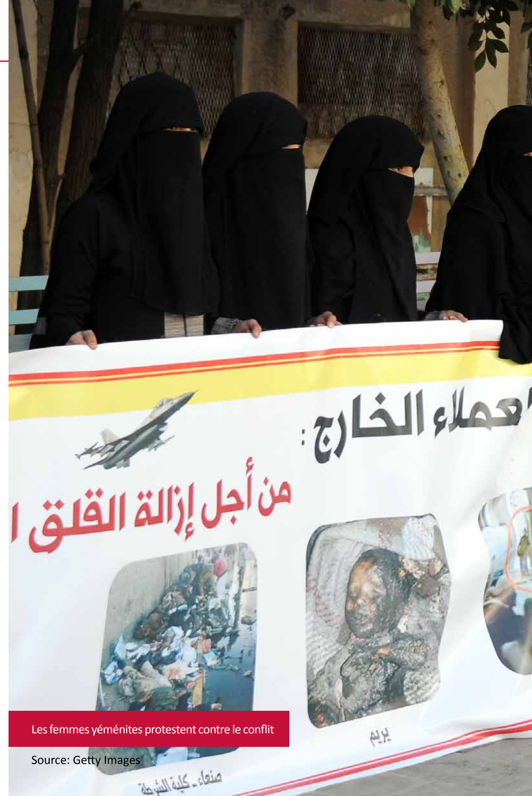
Les femmes yéménites protestent contre le conflit