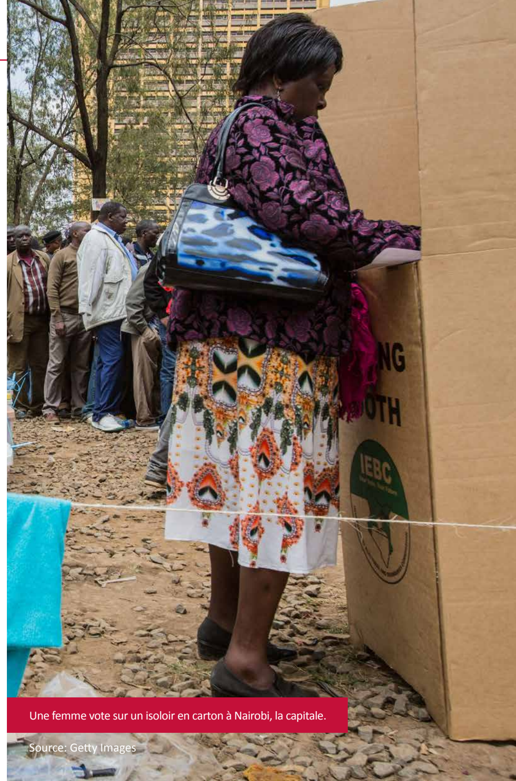
Une femme vote sur un isoloir en carton à Nairobi, la capitale.

À mesure que le processus électoral devenait de plus en plus polarisant, la violence politique éclatait à la moindre occasion. Amnesty International a enregistré au moins 66 morts dus aux violences concernant les élections entre août et novembre. Après le vote d'août, au moins 24 personnes , dont un bébé, ont été tuées alors que la police réprimait une manifestation de l'opposition. En novembre, la violence a éclaté dans les bastions de l'opposition après que la Cour suprême a confirmé le résultat du second scrutin. On pourrait fournir beaucoup d'autres exemples. Fait troublant, parmi les victimes se trouvait Christopher Msando , chef des services informatiques de l'IEBC, retrouvé étranglé en juillet. Son corps montrait des signes de torture.